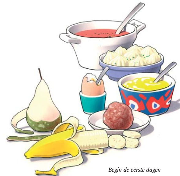
Begin de eerste dagen met zacht voedsel

Eten met uw nieuwe kunstgebit is wat onwennig. Zeker in het begin zult u voorzichtig aan doen. U ervaart zelf het beste wat wel en niet kan. Neem de eerste dagen zacht voedsel, zoals puree, gehakt en zacht fruit. Probeer enkele dagen daarna een stukje vis en een aardappel. Weer later kunt u voedsel eten zoals vlees of een appel. Stukken afbijten kunt u met een kunstgebit beter niet doen. Snijd uw voedsel daarom in stukjes en kauw rustig en gelijkmatig met uw nieuwe kunstkiezen. Neem daarbij aan beide zijden een stukje voedsel in de mond. Neem er iets meer tijd voor dan dat u gewend was.