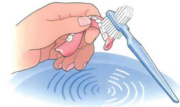
Reinig uw kunstgebit na iedere maaltijd

Uw kunstgebit is nu nog nieuw en mooi. Dat wilt u natuurlijk graag zo houden. Daarom moet u, net als bij eigen tanden en kiezen, uw kunstgebit verzorgen. Als u het niet regelmatig schoonmaakt, blijven er voedselresten achter. Zowel op uw kunstgebit als eronder. Als u die niet verwijdert, kan uw tandvlees op den duur gaan ontsteken. Reinig uw gebit daarom zorgvuldig na iedere maaltijd. Gebruik een speciale protheseborstel, bijvoorbeeld van Lactona of Oral-B, en water om etenresten goed te verwijderen. Gebruik géén tandpasta. Die kan te veel schuren. Een schoon kunstgebit voelt altijd glad aan. Laat uw gladde gebit tijdens het reinigen niet uit uw handen glippen. Het zal kapot gaan. Vul voor de zekerheid eerst de wasbak met water en reinig uw gebit daarboven.